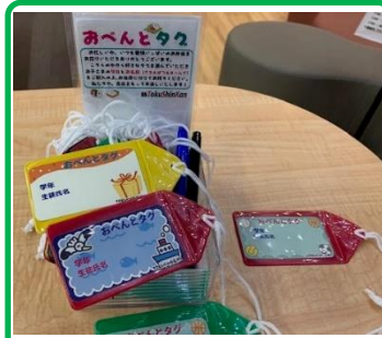
温かいお弁当を届けていただける保護者のみなさまに おべんとタグ を配布中。ぜひご利用ください!

その答えは、毎日やることです。覚えたいものを毎日「やる」ことです。単語や漢字であれば「書く・読む・見る」、歴史や年号であれば「ストーリーを確認する」など、自分が再現したいと思っている「行為」を毎日行いましょう。何時間やるとか何回やるとかそんなことよりも、毎日やるのが一番効果的です。なぜゲームの知識はすぐに頭に入るのか、それは毎日(もしくはそれに近いペースで)やるからです。これは暗記物だけではなく、ほかの内容にも通じることです。少しでもいいので毎日やるのが近道なのです。〔金子祐太〕