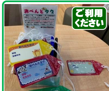
温かいお弁当を届けていただける保護者のみなさまに おべんとタグ を配布中。ぜひご利用ください!

その答えは、毎日やることです。覚えたいものを毎日「やる」ことです。単語や漢字であれば「書く・読む・見る」、歴史や年号であれば「ストーリーを確認する」など、自分が再現したいと思っている「行為」を毎日行いましょう。何時間やるとか何回やるとかそんなことよりも、毎日やるのが一番効果的です。なぜゲームの知識はすぐに頭に入るのか、それは毎日(もしくはそれに近いペースで)やるからです。これは暗記物だけではなく、ほかの内容にも通じることです。少しでもいいので毎日やるのが近道なのです。〔金子祐太〕