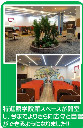
特進館学院新スペースが開室し、今までよりさらに広々と学習ができるようになりました!!

というものです。過去のディズニー作品にも同様の言葉があり、私も意識している言葉です。テスト結果に一喜一憂することも大事ですが、その結果に至った理由を分析すること、次からどうしていけばいいか考え、その気持ちを持続させることが次へと繋がります。課題テストの間違い直しを必ずし、その反省を次なる一歩に繋げていきましょう。〔厚地香里〕